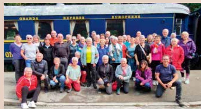
Photo prise lors du séjour « Monts et merveilles dans le Jura » du 13 au 20 septembre 2025

Contacts : 06 89 64 10 65 / 06 79 50 03 04 patrick.taldir@gmail.com / sylvie.leblanc1@orange.fr randonneursajoncs.wixsite.com/randonneurs-ajoncs/accueil