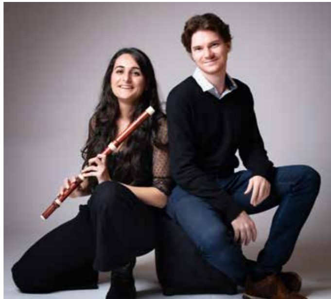
Artistes du concert Clavecin, traverso et orgue